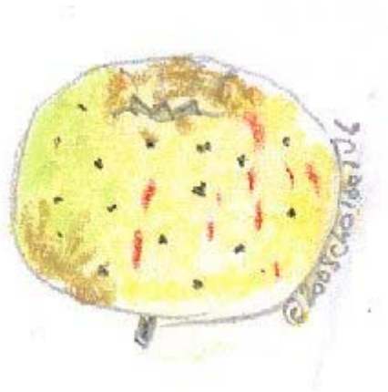
Pastel Choisel jean-louis 2008 selon Diel 1833, pl.22.

ORIGINE : Semis de l'ancienne Non Pareille fait vers 1780, par Stagg, arboriculteur à Caister, près Great-Yarmouth, comté de Norfolk. Cultivée depuis 1867 dans les pépinières A. Leroy, d'Angers.